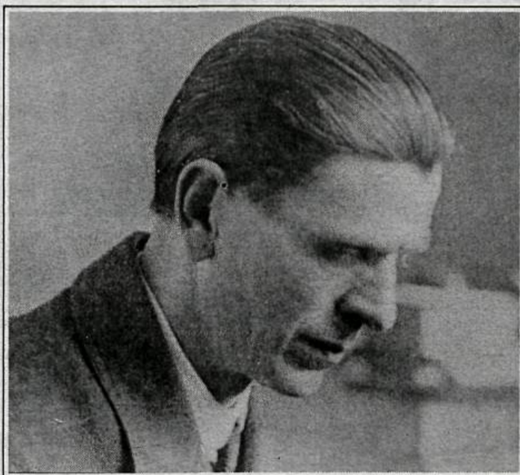
Hinn framliðni skákmeistari, Geza Maroczy, er teflir við Kortsnoj að handan.

Viktor Kortsnoj segir að þegar leitað var til hans um að tefla þessa sérstæðu skák hafi hann nefnt fleiri nöfn en Maroczy sem hugsanlega